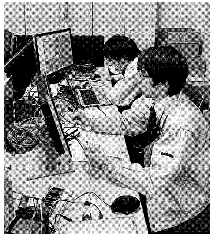
顧客視点に立つシステムを開発

ケーションを深める取り組みを行っている。パソコンやタブレット端末、スマートフォンなどで海外を含めたすべての社員が連絡を取ることができる。据付工事の現場などからも設備の状況を撮影し、質問できるので適切なアドバイスをもらうことができる。また、就業規則を見直す必要があるが、テレワークの導入も検討中だ。今後も社員が頑張っている環境づくりを継続し、100年企業を目指していく。